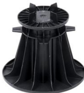
WSPORNIK REGULOWANY 150 - 260 mm

Soprema Polska Sp. z o.o. • Stefana Batorego 7 • Pass • 05-870 • Błonie Tel.: +48 22 436 93 02 • Fax: +48 22 436 93 06 E-mail: biuro@soprema.pl • www.soprema.pl NIP: 778-11-19-419 • REGON: 630703900 • KRS: 0000163897 Konto bankowe: Societe Generale 43184000072213616008101819 Sąd Rejonowy dla m.st. Warszawy • XIII Wydział Gospodarczy KRS Wysokość Kapitału Zakładowego: 19 000 000 PLN