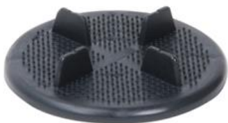
WSPORNIK NIEREGULOWANY 8 mm