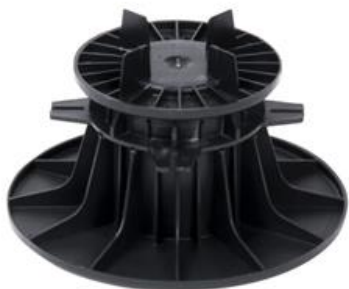
WSPORNIK REGULOWANY 90 - 150 mm