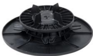
WSPORNIK REGULOWANY 40 - 60 mm