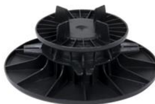
WSPORNIK REGULOWANY 60 - 90 mm