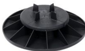
WSPORNIK NIEREGULOWANY 35 mm