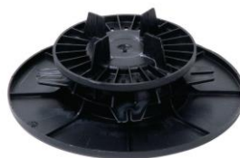
WSPORNIK REGULOWANY 25 - 40 mm