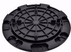
WSPORNIK REGULOWANY 8 - 20 mm